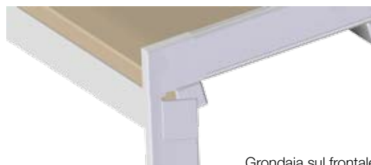
Grondaia sul frontale