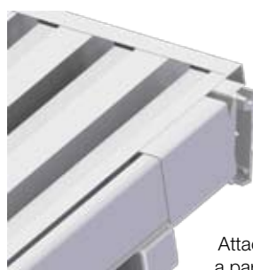
Attacco a parete