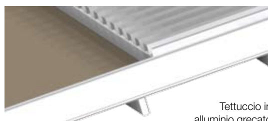
Tettuccio in alluminio grecato