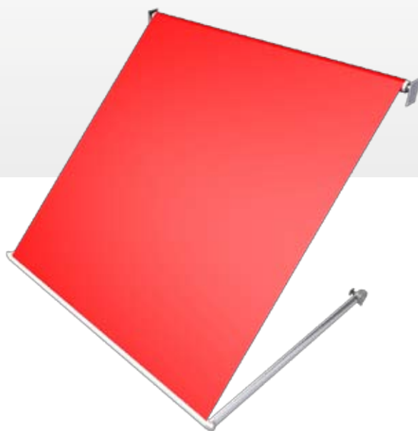
Tenda assemblata fino a cm 225